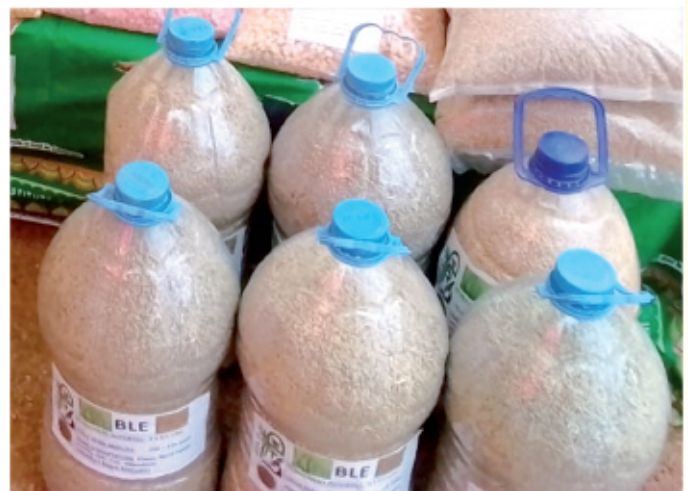
Maize grains stored in plastic bottle containers

These agricultural researchers concluded that the plastic boatels is the best among the six containers for storing maize and protecting them from weevils. After 3 - 4 months of storage, germination was only possible for seeds stored in the container. Using a model of this container with increased capacity will play an important role for managing storage weevils and fungal problem.