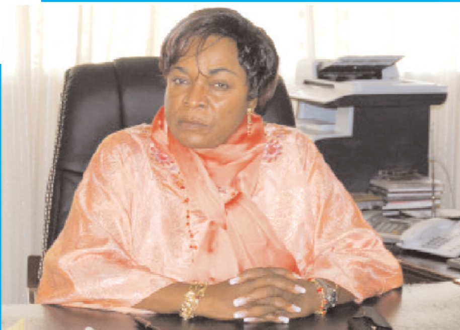
Dr. Madeleine TCHUINTE

Ministre de la Recherche Scientifique et de l'Innovation