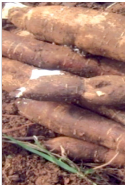
Tubercules de manioc