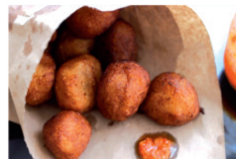
Beignets à la Farine de Manioc

NB : Certaines variétés de manioc ayant un seuil de toxicité élevé, il est recommandé de se rapprocher de l'Institut de Recherche Agricole pour le Développement (IRAD) qui produit des variétés améliorées dont le rendement et la qualité sont avérés.