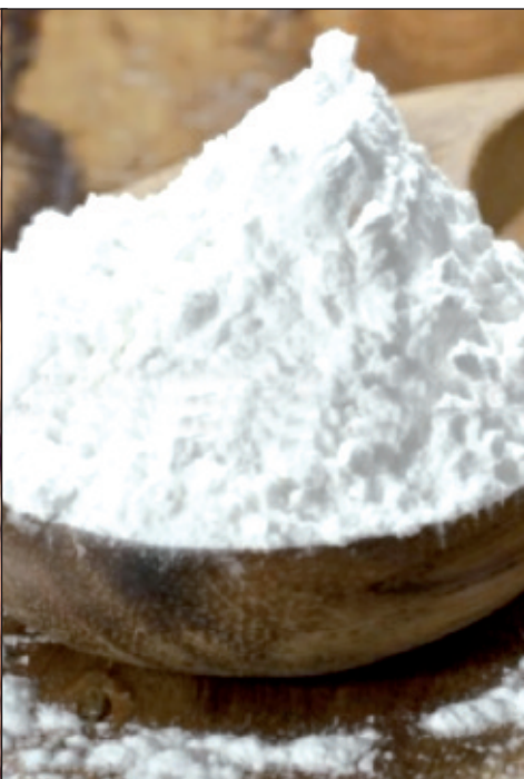
Farine de manioc

Le manioc est une plante à racines amyloacées, cultivée dans les régions tropicales. Bien qu'il soit devenu un aliment traditionnel africain, il est originaire du Brésil où il est appelé tapioca . Il fut déporté par les colons lors de la traite négrière pour nourrir à moindre coût les ouvriers. En effet, la culture du manioc semble moins contraignante que d'autres plantes et elle s'adapte à divers climats. L'on dénombre plusieurs variétés de manioc. Les feuilles de manioc se consomment généralement cuites. Cependant, la consommation du jus extrait des feuilles crues, très riche en fer, est recommandée pour les personnes souffrant d'anémie. Les racines du manioc qui peuvent se cuisiner en tubercules, sont également utilisées sous forme de farine dans le couscous de manioc, le gari jaune ou blanc, bâtons, Mintoumba , la fabrication de boisson alcoolisée Miquara et